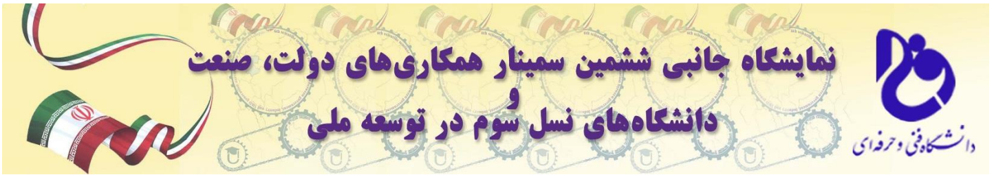
سر در ورودی نمایشگاه