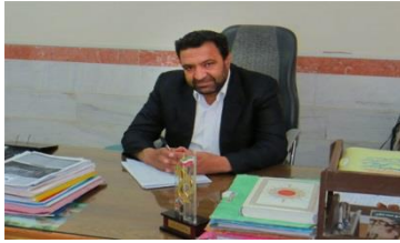
معاون دانشجویی فرهنگی دانشکده دبیر اجرایی سمینار