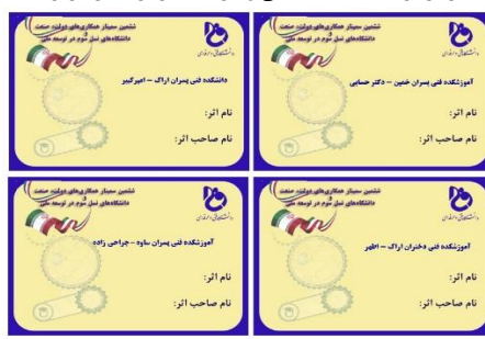
برجسب های طراحی شده برای آثار