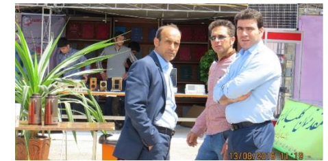
تعدادی از همکاران فعال در برگزاری سمینار و نمایشگاه