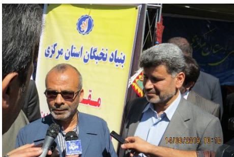
مصاحبه استاندار محترم مرکزی با خبرنگار صدا و سیما مرکز آفتاب