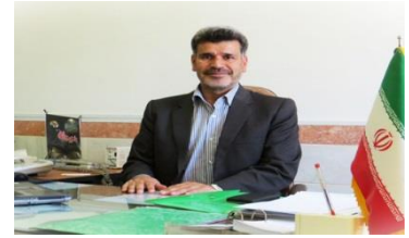
رئیس دانشکده دبیر سمینار