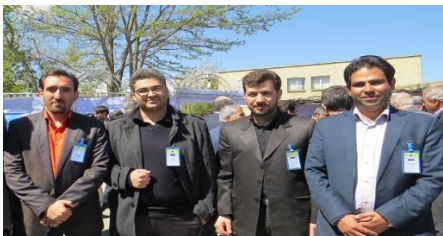
تعدادی از همکاران فعال در برگزاری سمینار و نمایشگاه