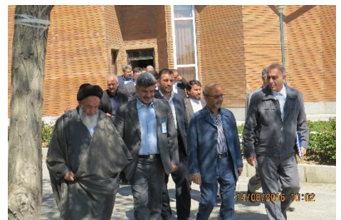
حرکت مسئولین حاضر در سمینار به طرف نمایشگاه