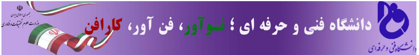
سر در غرفه های دانشگاه فنی و حرفه ای مراکز استان مرکزی