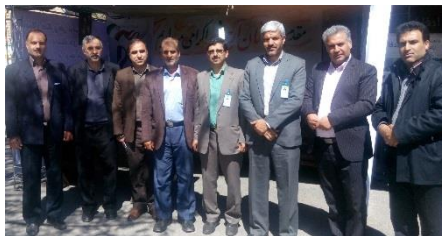
حضور جمعی از همکاران و مدیران گروه های آموزشی دانشکده