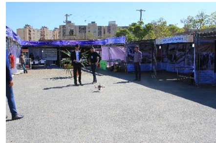
تست کواد عمود پرواز؛ از ابتکارات دانشجویان دانشکده امیرکبیر