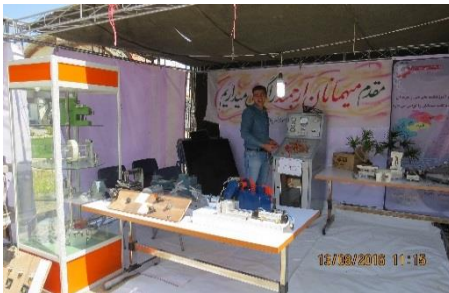
دانشکده پسران امیرکبیر و آماده سازی غرفه