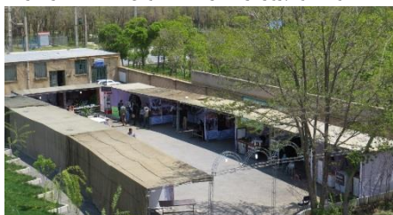
نمایی از نمایشگاه قبل از تکمیل و افتتاح