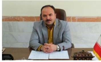
معاون آموزشی پژوهشی دانشکده دبیر علمی سمینار