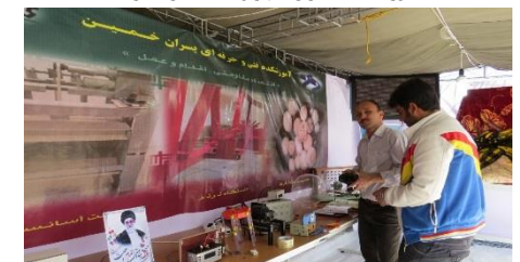
آموزشکده پسران خمین و آماده سازی غرفه