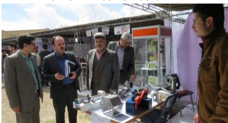
بازدید ریاست دانشکده و هیئت همراه از نمایشگاه قبل از افتتاح