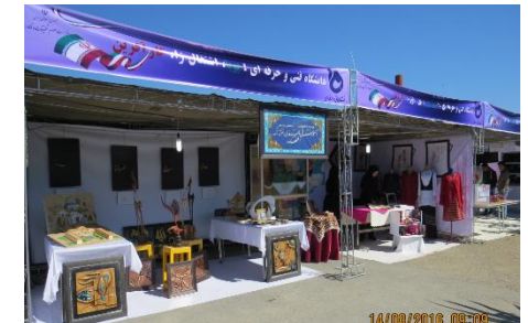
آموزشکده دختران اطهر و آماده سازی غرفه